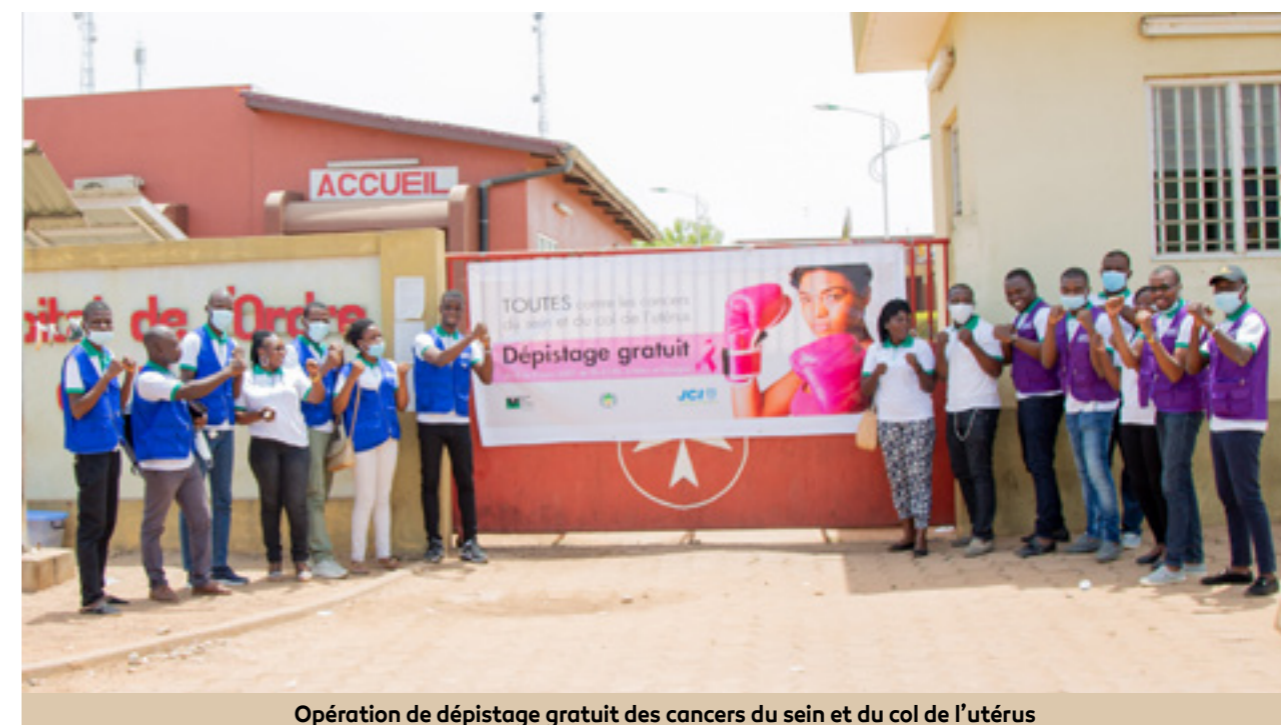
Opération de dépistage gratuit des cancers du sein et du col de l'utérus