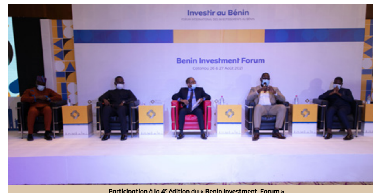
Participation à la 4 e édition du « Benin Investment Forum »