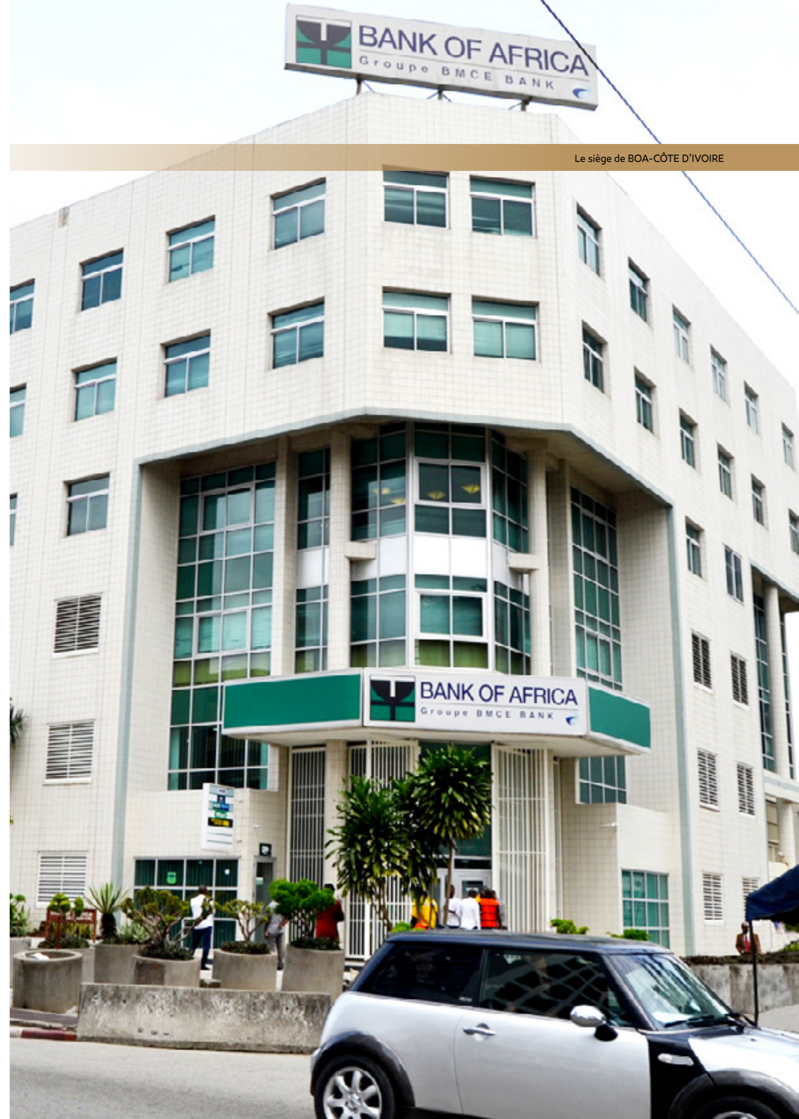
Le siège de BOA-CÔTE D'IVOIRE

Abidjan Plateau Angle Avenue Terrasson de Fougères - Rue Gourgas 01 BP 4132 Abidjan 01 - CÔTE D'IVOIRE Tél. : +(225) 27 20 30 34 00 - Fax : +(225) 27 20 30 34 01 SWIFT: AFRICIAB