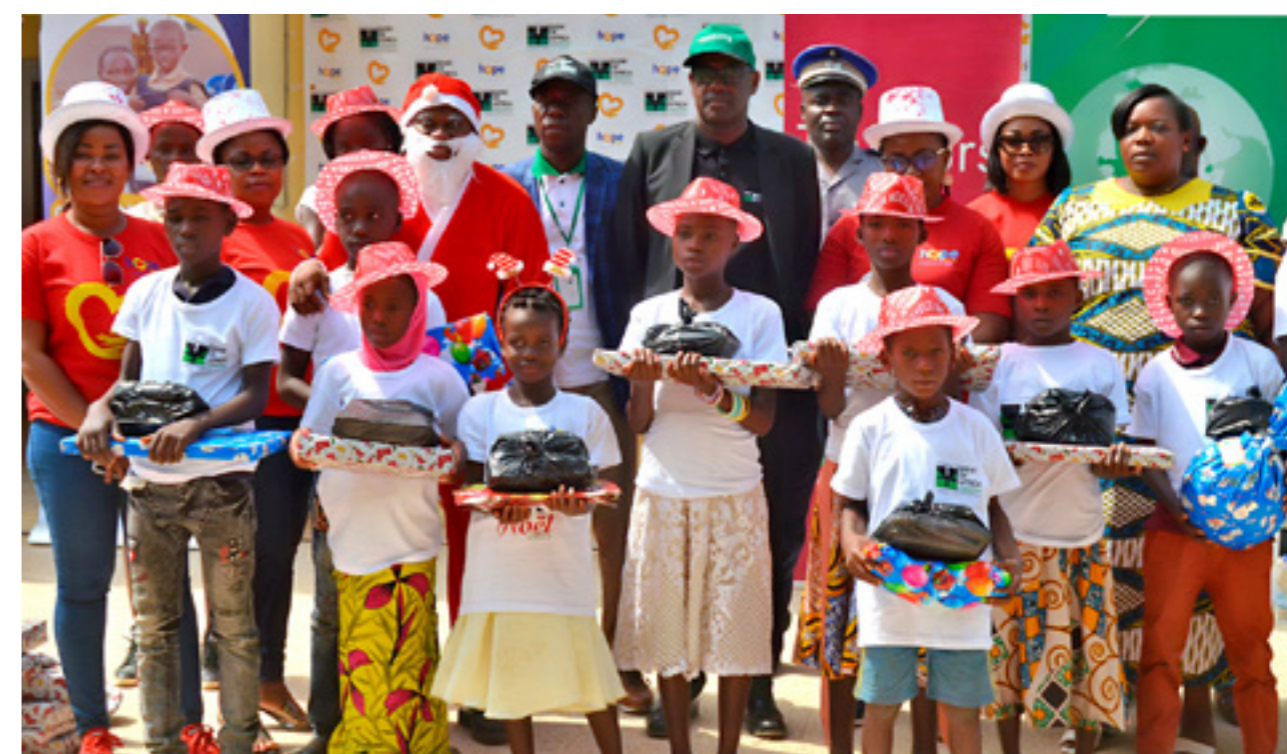
Organisation d'Arbres de Noël pour 1 000 enfants défavorisés