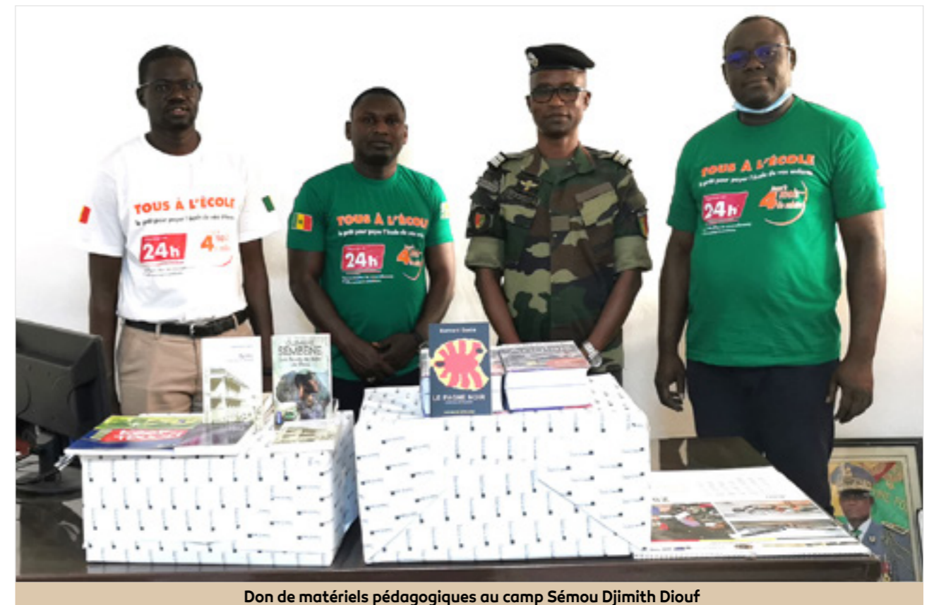
Don de matériels pédagogiques au camp Sémou Djimith Diouf