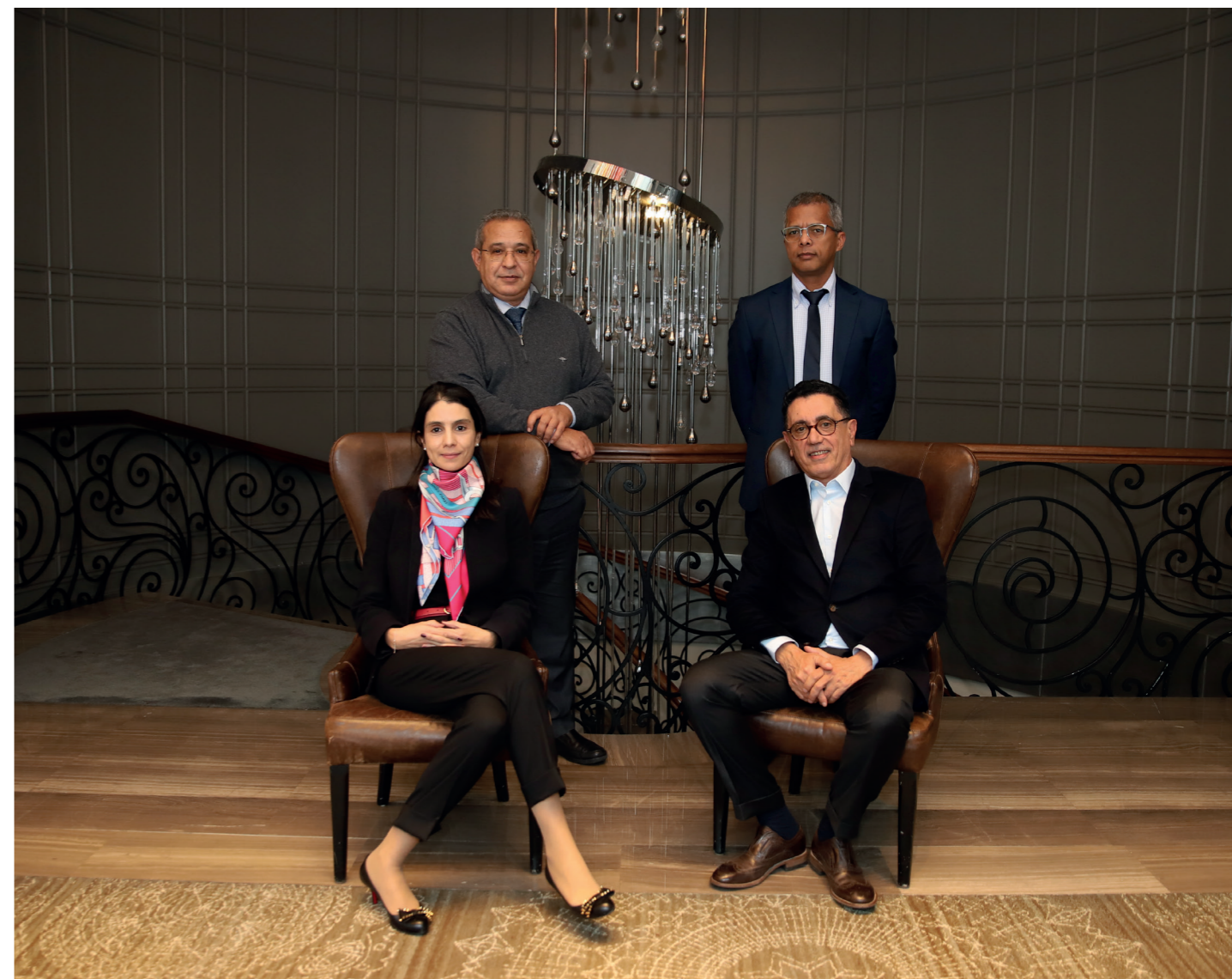
Le Conseil d'Administration de BOA-FRANCE

20, Rue de Saint Petersburg 75008 Paris - FRANCE Tél. : +(33) 1 42 96 11 40