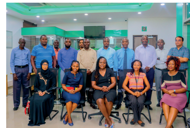
L'équipe de l'Agence Changamwe