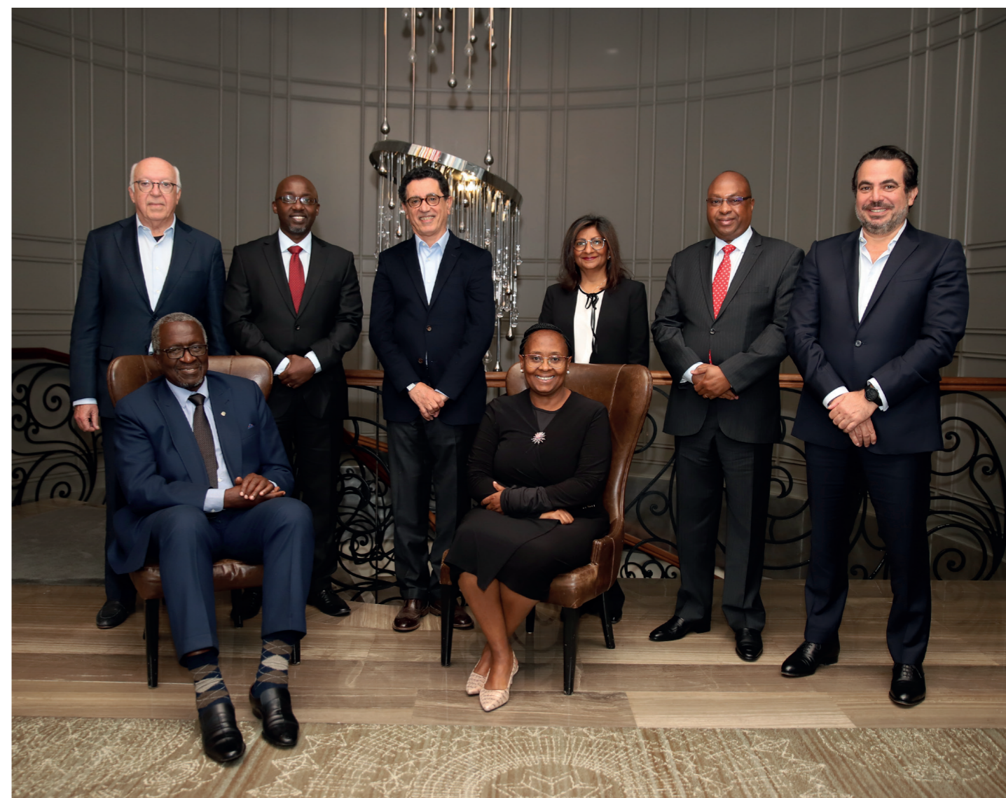
Le Conseil d'Administration et le Directeur Général de BOA-KENYA

BOA House, Karuna Close off Waiyaki Way, Westlands P.O. Box 69562-00400 - Nairobi - KENYA Tél. : +(254) 20 327 5000