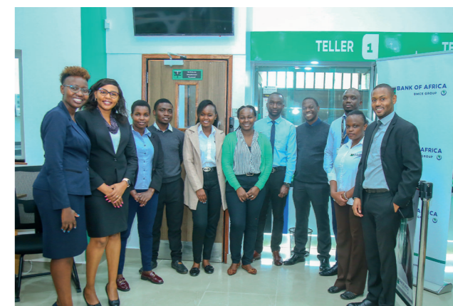
L'équipe de l'Agence Ngong Road