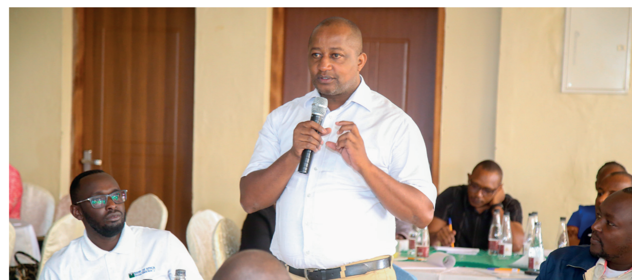
Séminaire « PME et CHALMA Clinics »