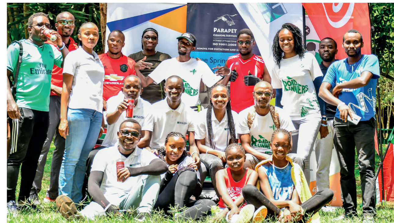
Participants de la banque à la course cycliste organisé par le Rotary Club

BOA-KENYA a été l'un des principaux partenaires d'un événement sportif, « End Polio Now », organisé par le Rotary Club en février. Les fonds récoltés alimentent un fonds pour des actions de sensibilisation à la maladie.