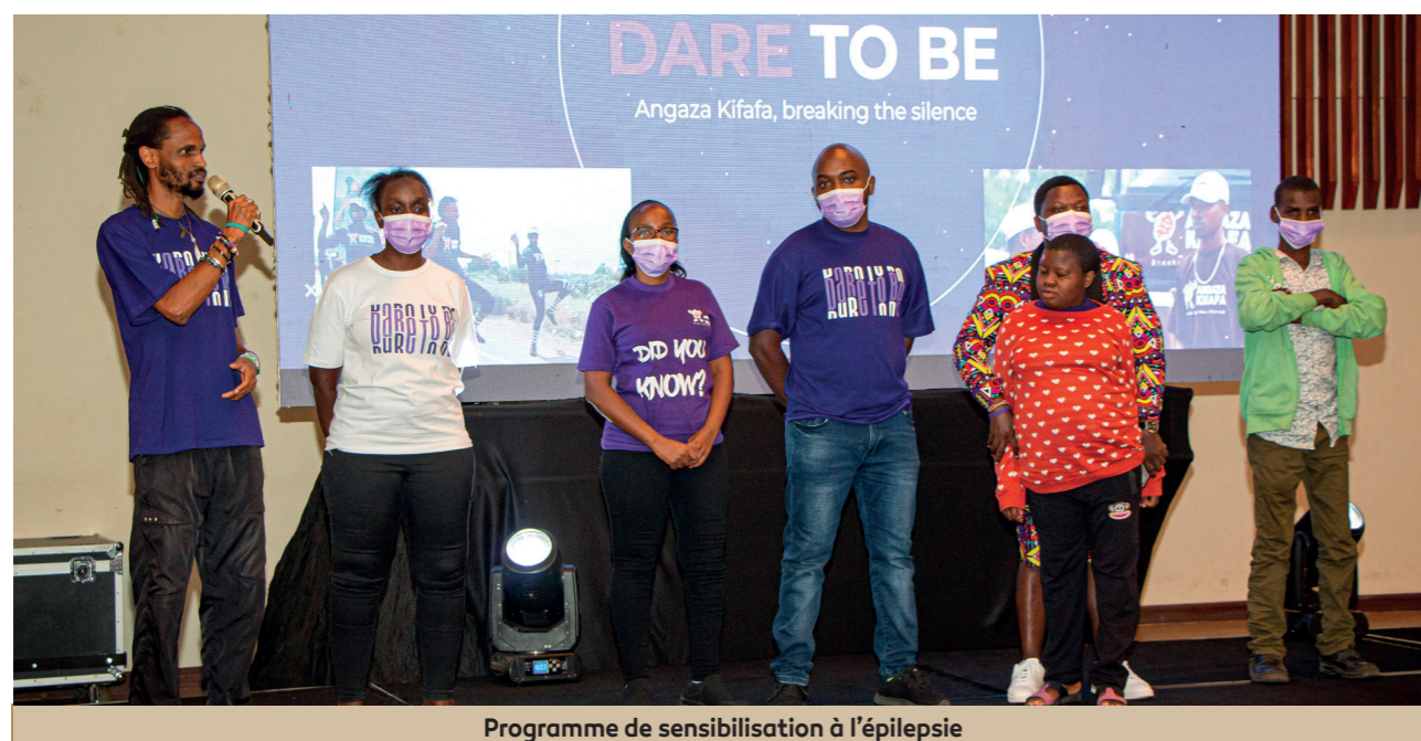
Programme de sensibilisation à l'épilepsie