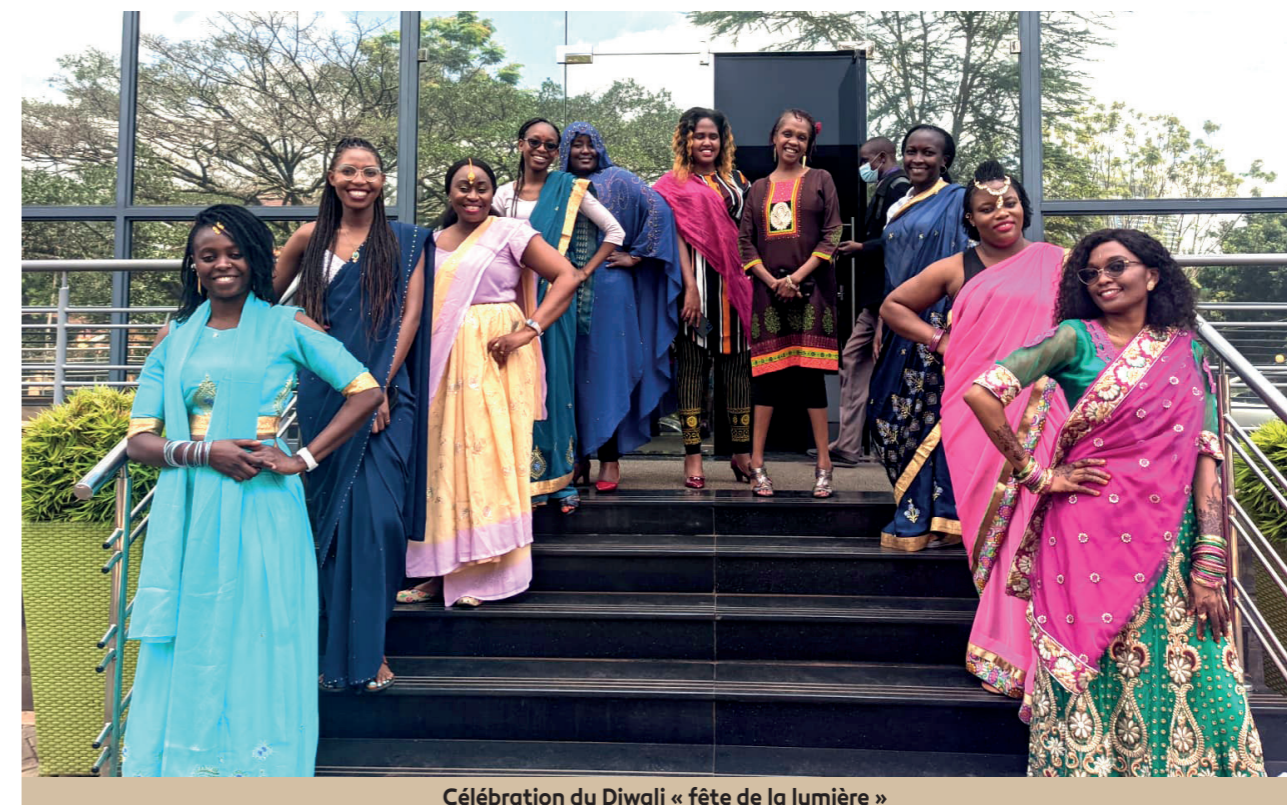
Célébration du Diwali « fête de la lumière »