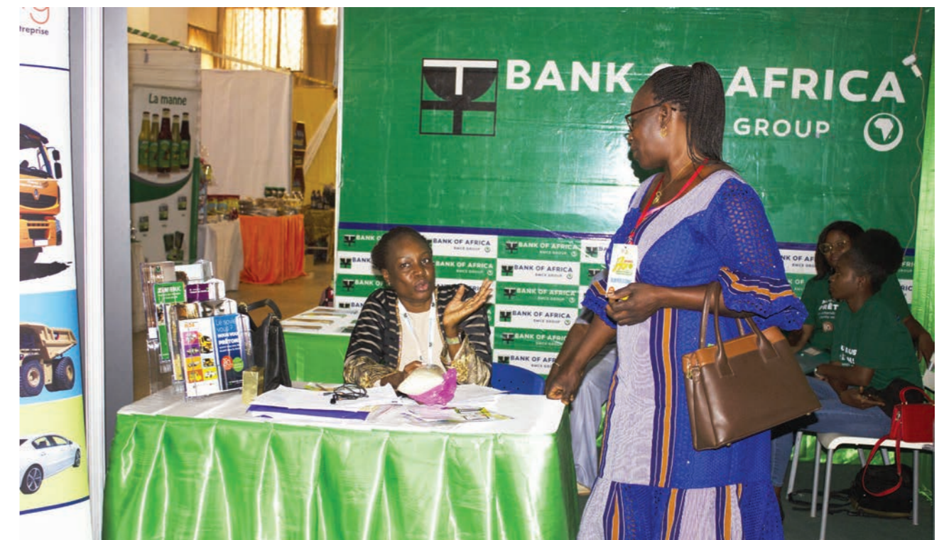
Stand BOA lors de la 12 ème édition des Journées Agro-Alimentaires