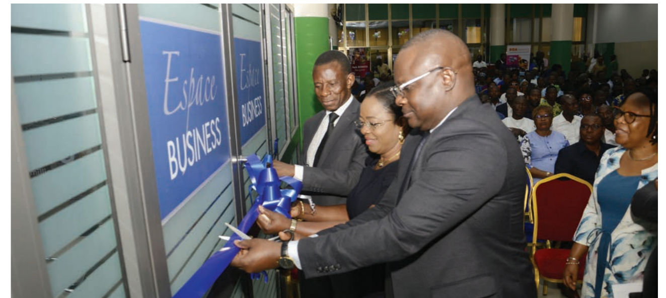
Inauguration d'un Espace Business, Agence Ganhi