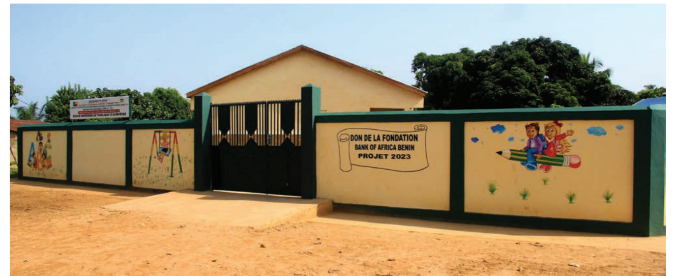
Rénovation de l'École maternelle Albarika, à Parakou