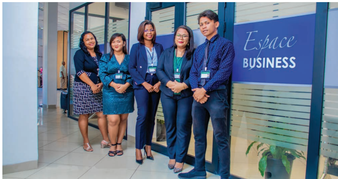
L'Espace Business de Mahajanga