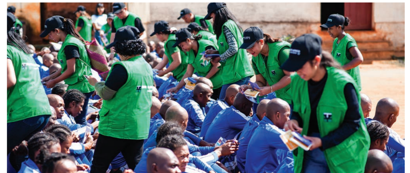
Action marketing dans une école militaire (ENIAP)