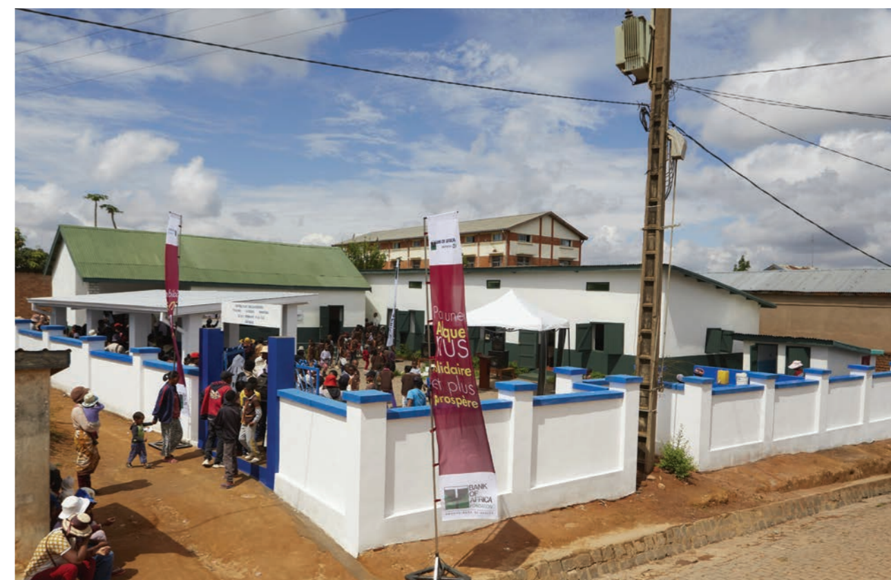
Rénovation d'une école primaire