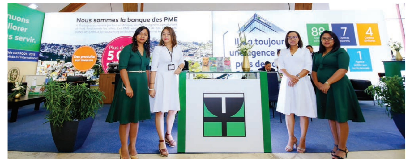
Stand BOA à la Foire Internationale de Madagascar