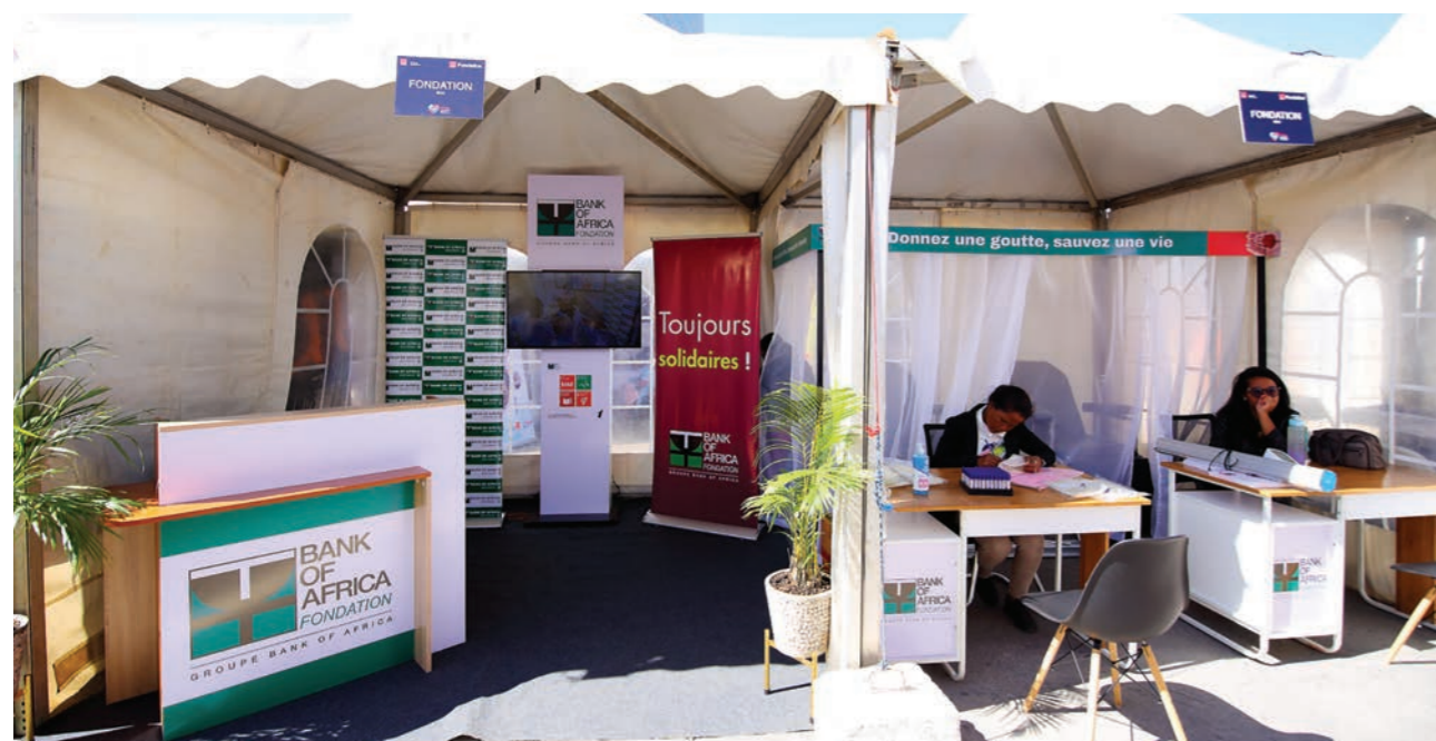
Opération de don de sang