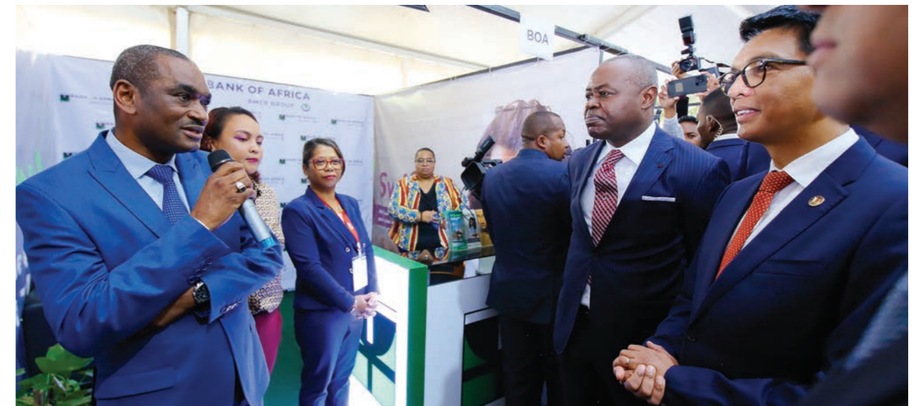
Stand BOA lors de l'ITM