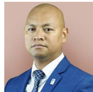
Tsirofy Mihamina RATOVOHARINONY Représentant de l'Etat Malgache