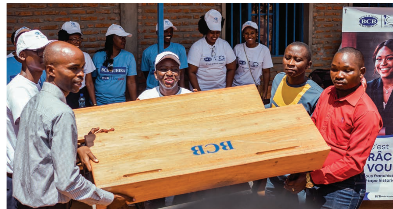
Don de table-bancs à l'Ecole Fondamentale de Gishingano