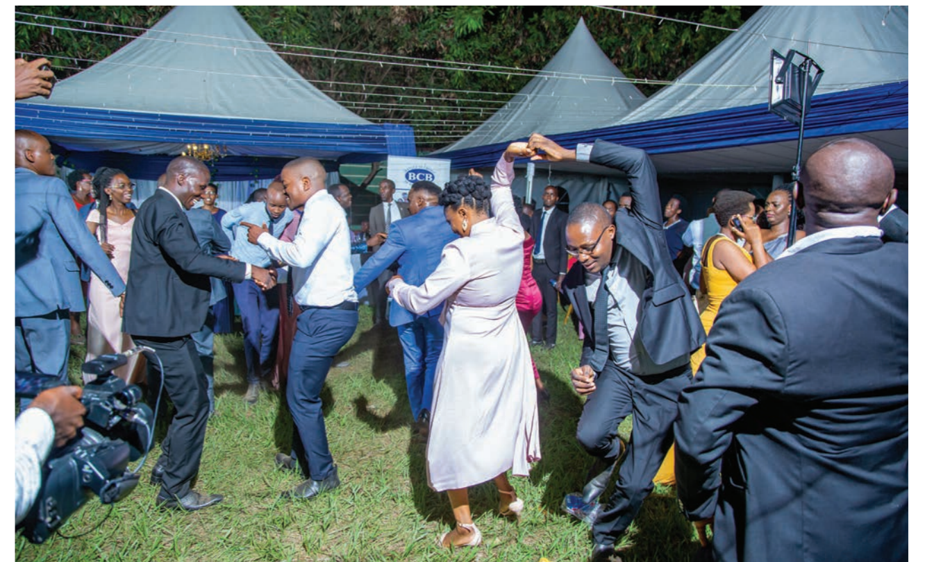
Fête annuelle du personnel