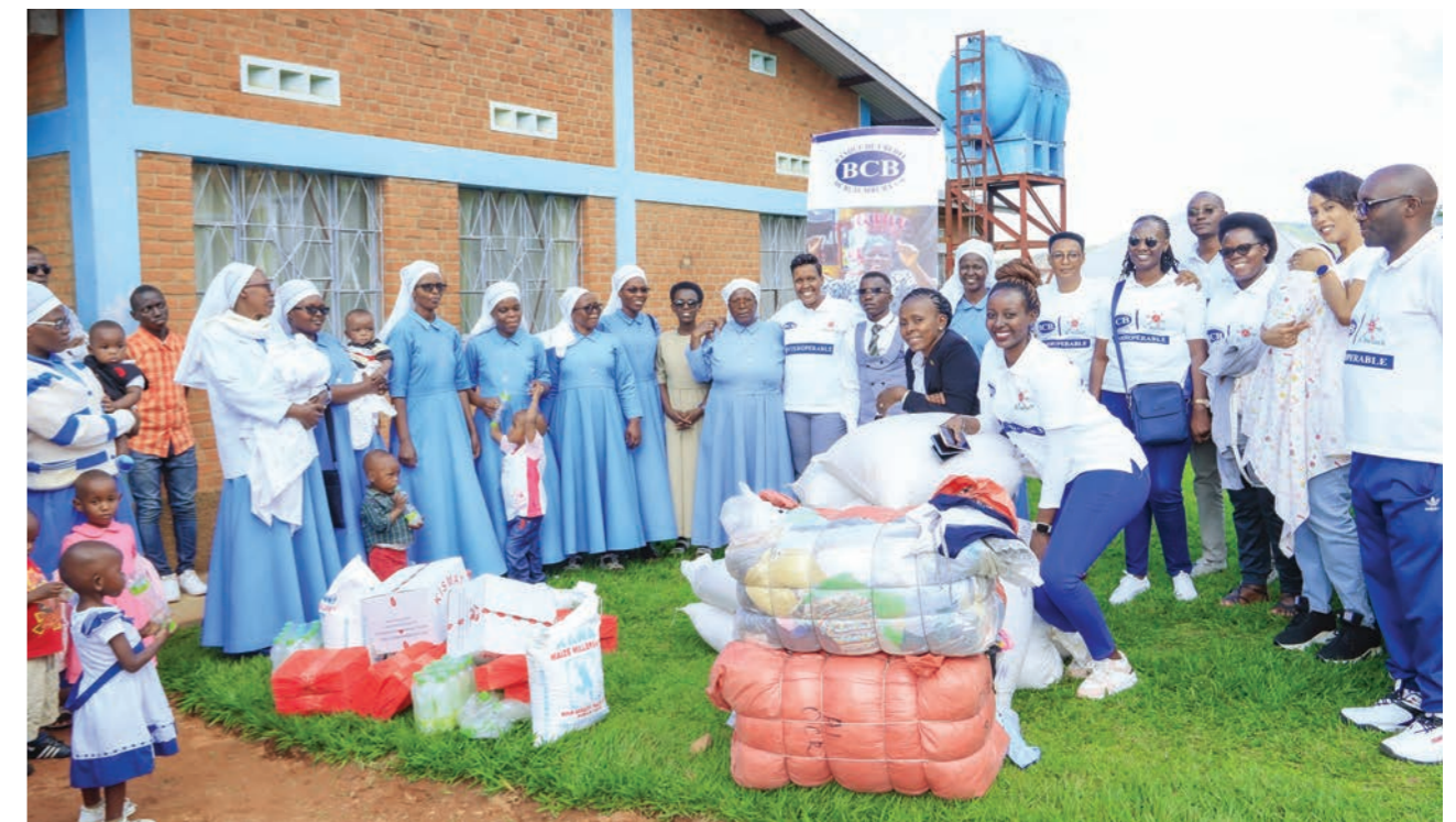
Dons à l'orphelinat des Benne Bernadetta