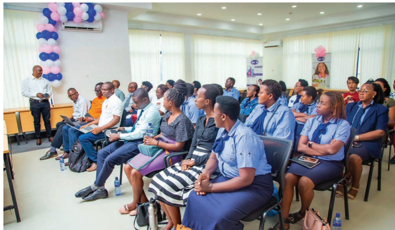
Sensibilisation aux cancers du sein et du col de l'utérus