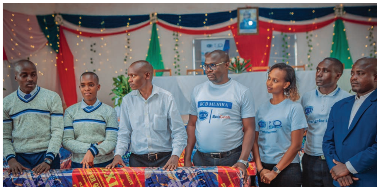
Soutien au Lycée d'Excellence de Makamba