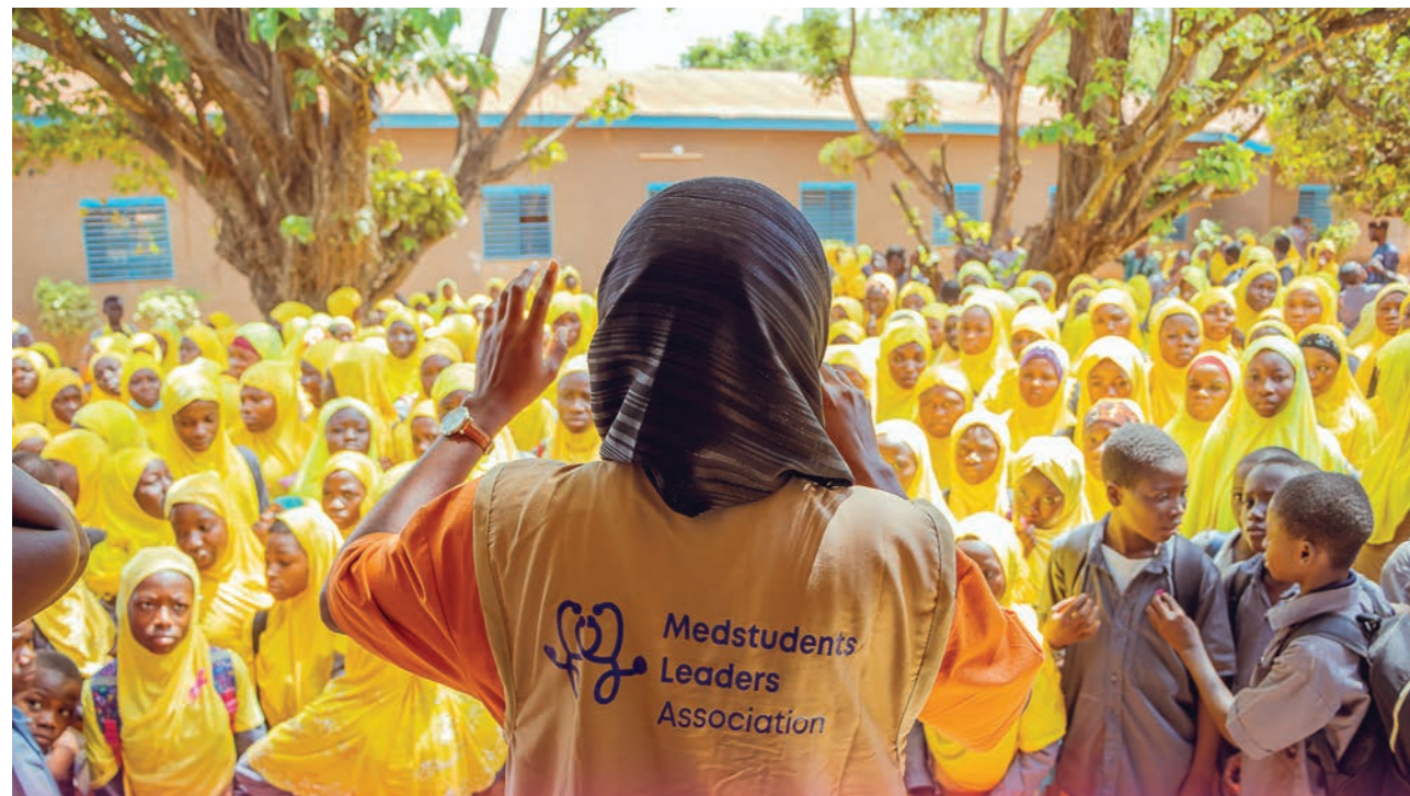
Campagne de sensibilisation sur la lutte contre les cancers du sein et du col de l'utérus.