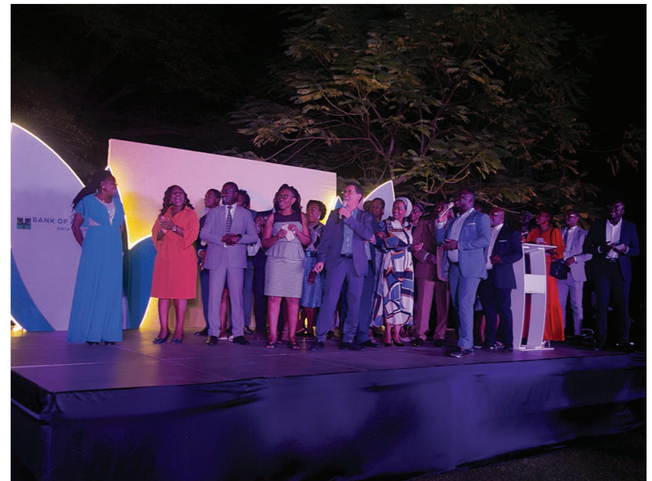
Célébration du 10 e anniversaire de BOA-TOGO