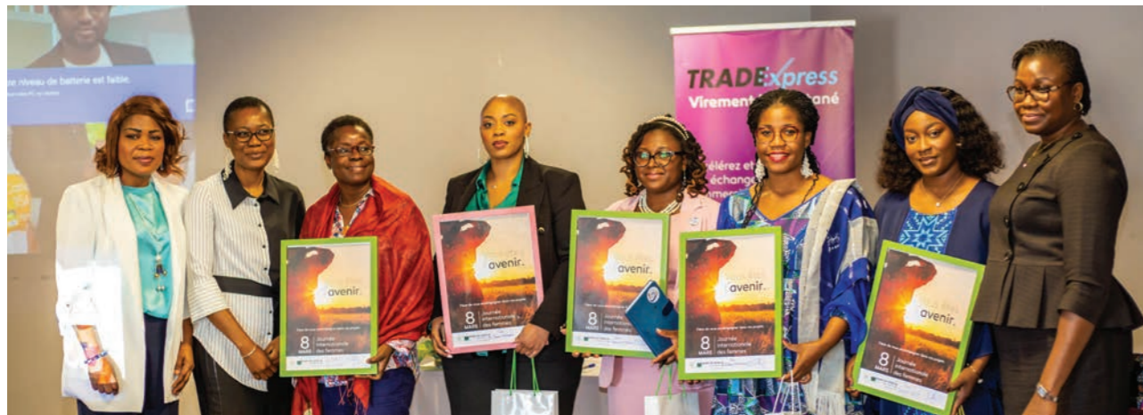
Célébration de la Journée Internationale des Droits des Femmes

Boulevard de la République, 01 BP 229 - Lomé – TOGO Tél. : +(228) 22 53 62 62