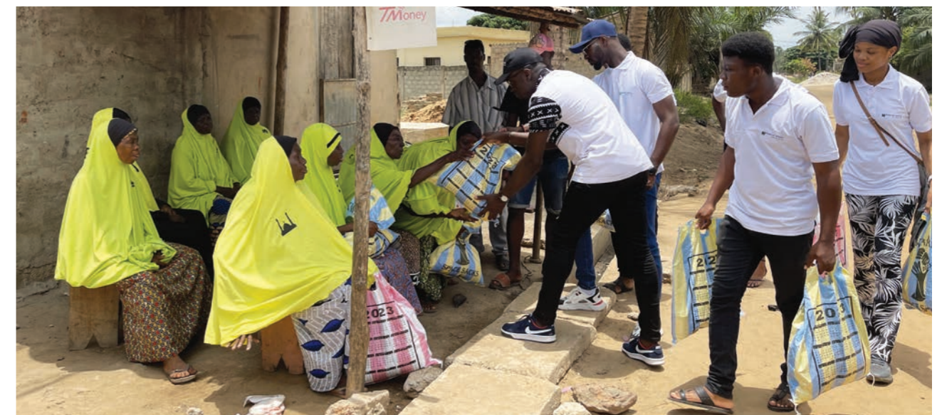
Don de vivres à l'occasion de la fête de Pâques